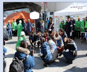
「帰宅困難者対応およびシェイクアウトの訓練」 (千代田区秋葉原・平成26年3月)