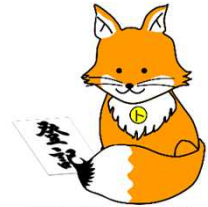
不動産登記推進イメージキャラクター「トウキョウキツネ」