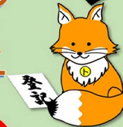
不動産登記推進 イメージキャラクター 「トワキツネ」